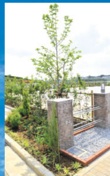
レンガと自然石で仕上げた上品な水場