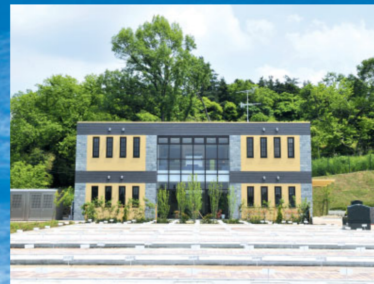
明るい日差しがいっぱいに差し込む霊園管理棟