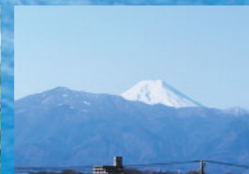
霊峰富士を望む園内