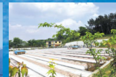
緑に包まれた園内