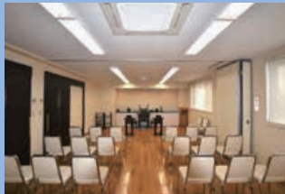
冷暖房完備の要業堂