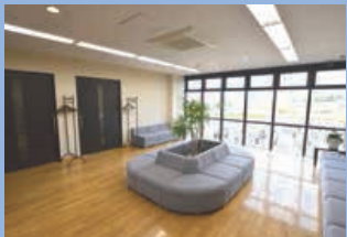
2階待ち合いスペース