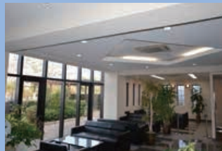
広々とした管理棟ロビー