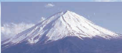
園内からは世界文化遺産「富士山」を望めます。

30年 緑化認定を受けた 緑あふれる霊園 緑地をたっぷり整備した証(あかし)。 横浜市から「緑化認定」を受けた霊園です。