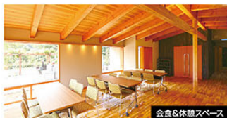
会食&休憩スペース