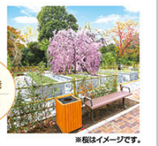
※桜はイメージです。

樹木葬 家族永代供養さくら 79.8万円 しいだ桜がシンボルの やすらぎ溢れる樹木葬 ご家族で ご使用可能 ペット共葬 区画あり