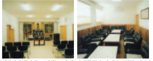
長谷寺客殿法堂、ご法事・ご法要にご利用いただけます。 客殿休憩室、和室もご利用いただけます。