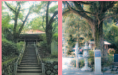
飯山観音の門守尊で仁王像(金剛力士像)が安置され、室町時代の建立と寺歴は伝えています。「かながわ名木百選」にも選ばれているこの木は、樹齢400年余と伝えられ市の天然記念物です。