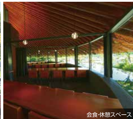
会食・休憩スペース

【狭山湖畔霊園概要】●所在地/埼玉県所沢市大字上山口2050 ●経営管理/公益財団法人エターナリカ、内閣総理大臣認定(府益担第4777号) ●総面積/約50,000㎡ ●総区画/約4,500区画 ●許可/墓地経営許可指令所保第345号 ●施設/管理事務所・休憩所・礼拝堂・会食室・駐車場・水道施設・東屋・屋外トイレ・納骨堂・合祀墓 ●永代供養制度 ●定休日/水曜日 ●宗教/宗派不問