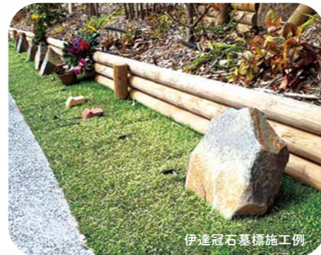
伊達冠石墓標施工例